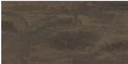
Sofia Cuprum 2021